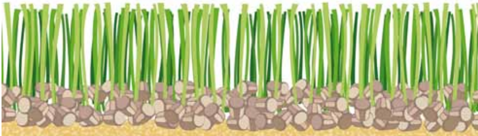
Opbouw traditioneel: kunstgrasmat met rubber infill, deze wordt geplaatst op een harde fundering (meestal lava).