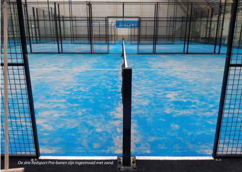
De drie Redsport Pro-banen zijn ingestrooid met zand.