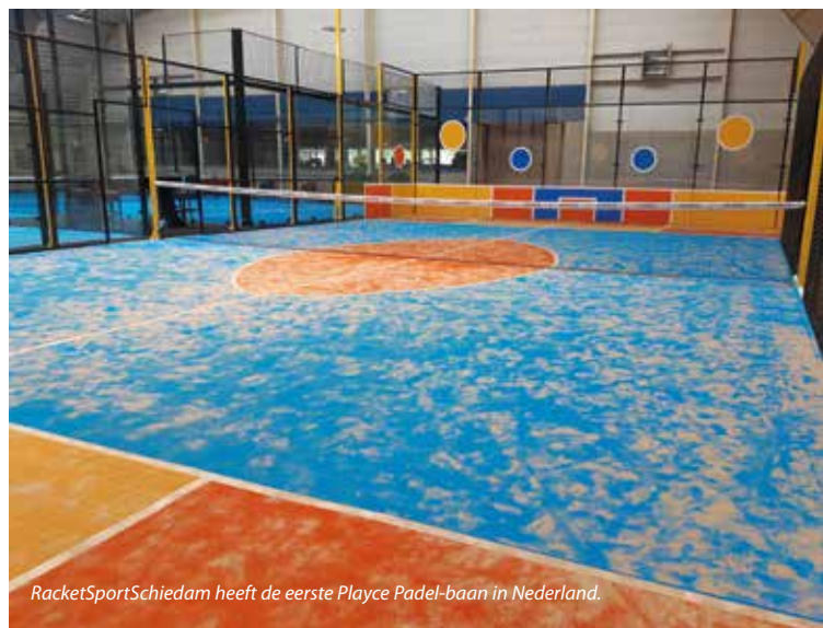
RacketSportSchiedam heeft de eerste Playce Padel-baan in Nederland.