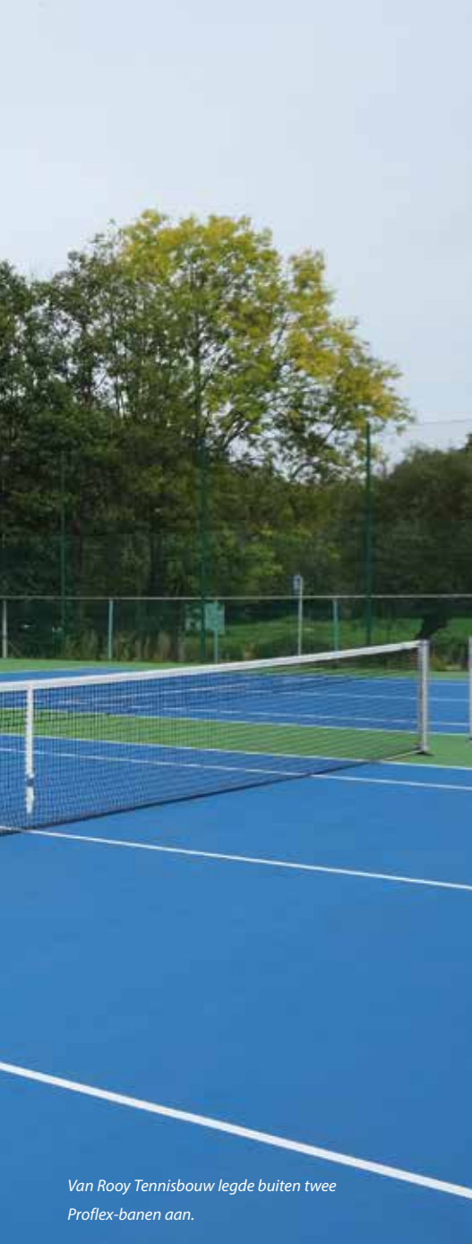
Van Rooy Tennisbouw legde buiten twee Proflex-banen aan.

onderbouw. Volgens René van Vliet koos TTV vooral voor de vijf binnenbanen vanwege de dempende werking die hun tennisvloer heeft: 'Uiteraard zijn eerst de bestaande coatinglagen geschuurd. Op de bestaande acrylaatlaag hebben we een rubbermat van 5 mm verlijmd. Daarop is een 1 mm dikke kunststof tussenlaag aangebracht. Daarna is in twee lagen de polyurethaan (pu)-coating aangebracht. De gebruikte polyurethaan is sterk, elastisch en duurzaam. Dit is ook een product dat niet verhardt!' Deze tennisvloer, Proflex Elite, werd vroeger Tennisfloor Pro genoemd; de specificaties moesten dus onder die naam gezocht worden op de Sportvloerenlijst.