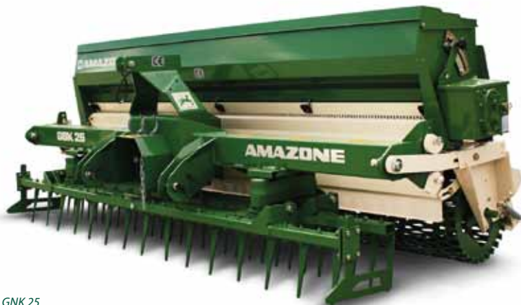
Amazone GNK 25

De Shockwave 210 is het breedst in deze serie; hij gaat tot 25 centimeter diep. De grotere werkbreedte zorgt uiteraard voor meer capaciteit, terwijl er toch nog met een compacte tractor gereden kan worden. Doordat de machine weinig draaiende delen heeft, is hij voor loonwerkers en gemeenten een ideale aanvulling. De topklaag wordt met roterende messen tot op grote diepte doorsneden, waarbij de grond ertussen losgeschud wordt met minimale verstoring van het speleoppervlak. Dit gebeurt door ronddraaiende messen die om beurten door de grond snijden, de grond daarbij zijdelings verplaatsen en heen en weer schudden. Het resultaat is een goed beluchte grasmat.