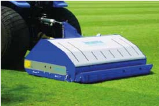
Imants Shockwave 210