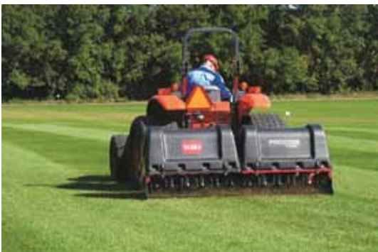
Toro Procure 1298