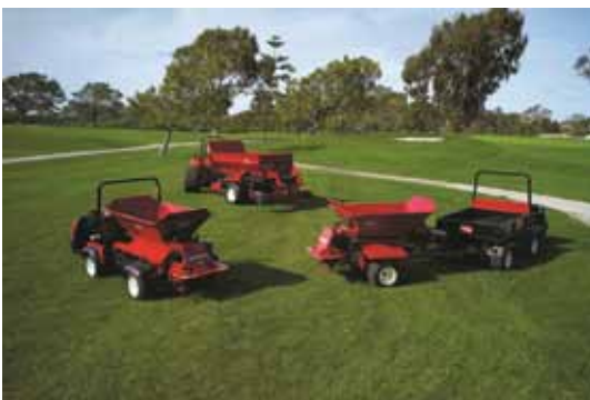
Toro Propass MH-400