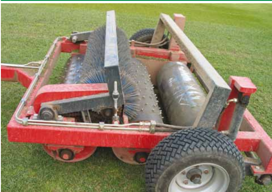
Op de betredingsproeven wordt gedurende twee speelseizoenen ongeveer tweemaal per week met een dubbele noppenrol over de veldproeven gereden. De beide rollen zijn zodanig met elkaar verbonden dat ze verschillende draaisnelheden hebben, waardoor er een slidingeffect ontstaat. Hiermee kan het voetballen goed worden gesimuleerd.

Ik vind de opmaak duidelijk, maar als je naar de Engelse grasgids kijkt dan hebben de verschillende toepassingen verschillende kleuren, dit zoekt wel makkelijk. Dus bijvoorbeeld sport blauw, gazon geel, recreatie groen en bermendijken rood of zo iets. Verder zou ik niet teveel aan de grootte veranderen, dit is oké. Inhoudelijk komen er via Plantum nog wat aanpassingen.