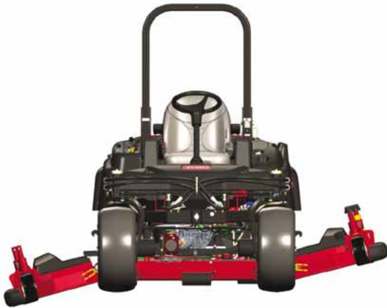
Toro 360 met 2,50 werkbreedte.