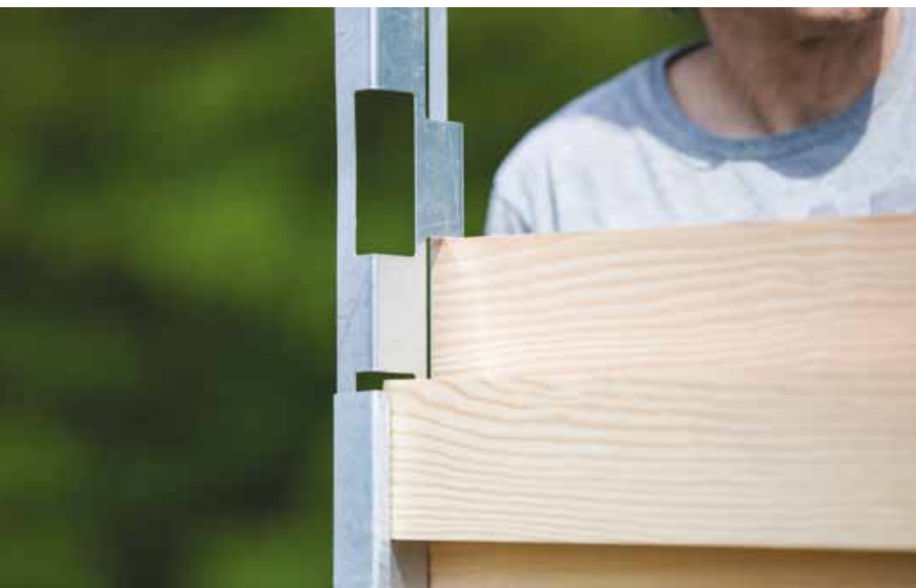
Mueller Schroefloze Schuttingen.

Een sympathieke vinding komt van de Duitse