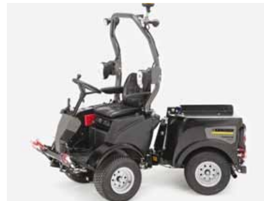
Kärcher werktuigdrager MIC 26

Kärcher is misschien niet een naam die je op een dergelijke groenbeurs verwacht tegen te komen. De kans bestaat echter dat je die visie snel zult moeten aanpassen. Kärcher heeft met de overname van het failliete Belos een complete lijn werktuigdragers in huis gehaald en werkt momenteel aan de uitbreiding en doorontwikkeling van deze machines. Nieuw is bijvoorbeeld de MIC 50, een werktuigdrager met een 50 pk Kubota, waaraan vijf verschillende werktuigen gekoppeld kunnen worden. Er zal ook een kant-en-klare veeg- en zuigwagen voor binnensteden te zien zijn. Deze machine blijft met volle lading onder de 3,5 ton.