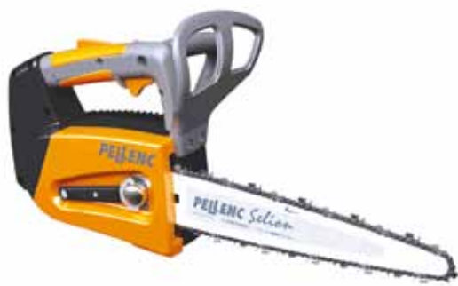
Pellenc Selion C20

Dolmar lijkt op dit moment zijn kaarten nog te verdelen over de verschillende energiebronnen. Accu als het kan, tweetakt als er power nodig is, maar op Galabau wordt ook een stevige versterking van het viertakt-gamma getoond. Tweetakt is de nieuwe PS-6100. Een motorzaag die krachtig genoeg zou zijn om grote bomen te rooien, maar ook licht genoeg om dezelfde boom daarna van zijn takken te ontdoen. Best of both worlds dus. Ook accutechnologie is belangrijk voor Dolmar, maar Dolmar blijft steken bij 36 V, waar de concurrenten vaak al tot 44 volt gaan. Wel biedt Dolmar slimme oplossingen met de comptabiliteit van accu's. De twee accu's van een 18 V Makita schroefmachine kunnen via een cassette een 36 V Dolmar heggenschaar of trimmer aandrijven.