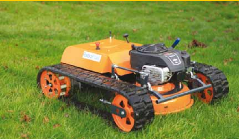
Kommtek RoboFlail one