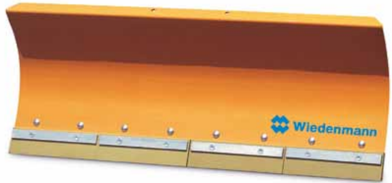
Wiedenmann met Vario-Schild