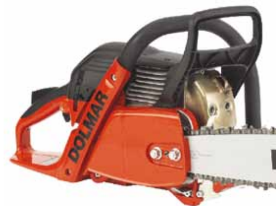
Dolmar PS 6100