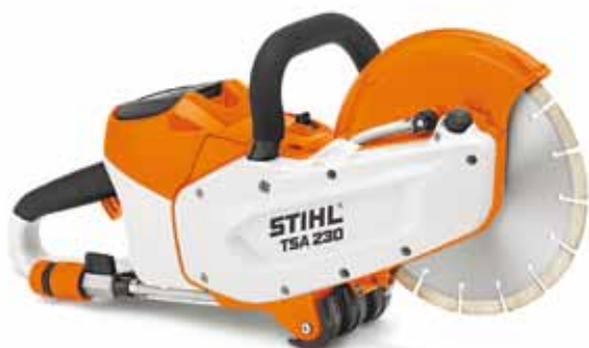
Stihl TSA230 doorzager