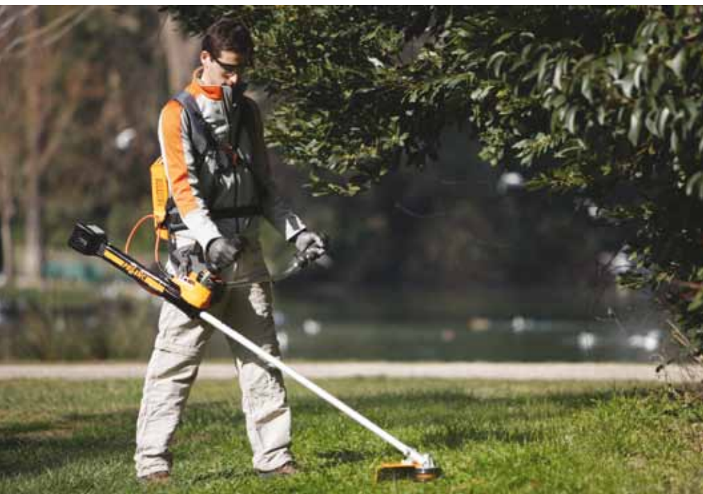
Pellenc excelion 2000

Pellenc komt op de beurs met de Excelion 2000. Voor Nederlandse klanten is dat waarschijnlijk