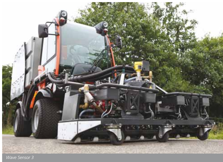
Wave Sensor 3

van een splitter. Greenmax toont ook het Airmax-beluchtingsstelsel, speciaal voor granulaat. Dit systeem is voorzien van flexibele stijgbuizen, zodat je de eindstukken altijd in de boomspiegel kunt laten uitkomen. Dit systeem is leverbaar als kant-en-klare set, maar ook in de vorm van losse onderdelen.