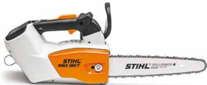
Stihl MSA160T accu-tophandle