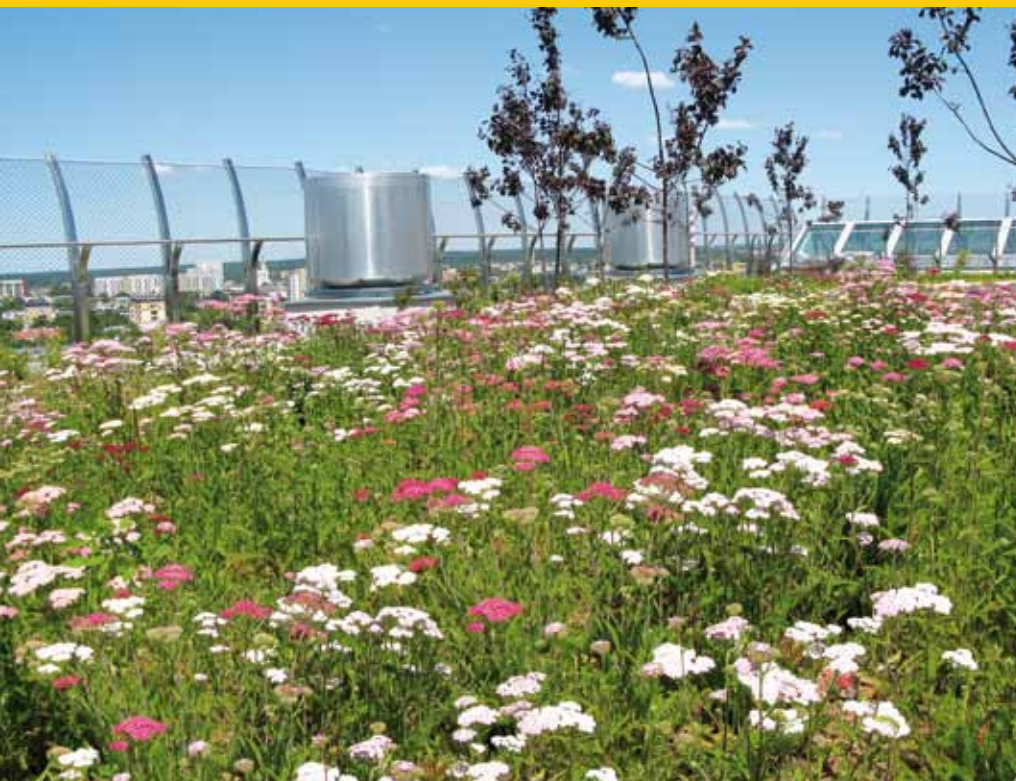
Zinco Aquatech - Bloemenweide op een grasdak in Polen.