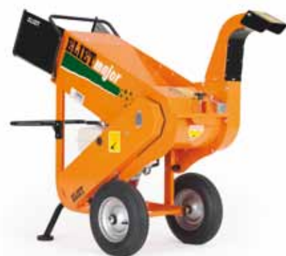
Eliet Major 4S Versnipperaar

Een ander Nederlands bedrijf op de Galabau-preview was Greenmax. Dit bedrijf toont onder andere het Luwa-systeem. Dat is een beluchtingsstelsel voor bomen, dat ook gebruikt kan worden om te bewateren. Het is gebruikelijk om water in de beluchtings slang te gieten, en op zich is daar weinig op tegen. Het effect is alleen zeer gering, omdat je het water daarmee onder de kluit brengt, waar de wortels van de boom niet bij kunnen. Het Luwa-systeem is daarom voorzien