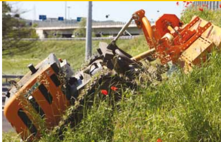
Kommtek RoboFlail Vario