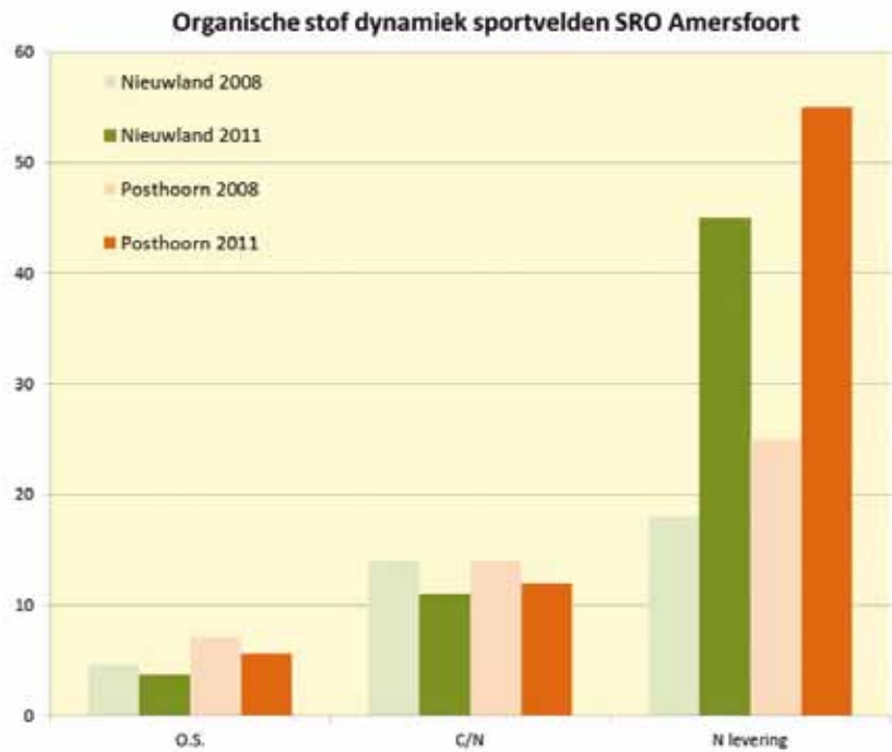
Lager organisch stofgehalte, lagere C/N-verhouding en nalevering voedingsstoffen bij SRO Amersfoort.

Anderzijds kun je je voorstellen dat de clinoptiloliet-korrels als waterbuffer fungeren. Zodra de graswortels voldoende zuigkracht op de bodem uitoefenen, treedt het water uit de dunne capillairen van de korrels en is het beschikbaar voor de graswortels. Daarbij is het van belang te weten dat de zuigkracht van gras uitgedrukt in centimeters waterkolom ongeveer 150 keer zo hoog is als de veldcapaciteit. Stor-it-korrels kunnen echter een nog sterkere zuigkracht uitoefenen, en daarmee vocht dat normaal niet beschikbaar is capillair maken. Overigens blijven de korrels ook bij volledige verzadiging met vocht hun capillaire werking behouden. In de bodem krijg je een permanent spel van water dat in en uit de clinoptiloliet-korrels gaat; dit zorgt zelfs voor vermindering van de evaporatie bij een droge, schrale wind.' Ook blijkt volgens Terlouw dat de combinatie van Stor-it en Vitalbase een belangrijke rol speelt in de zogenaamde aggregaatvorming: 'Een aggregaat is een soort samenklontering van zand, mineralen en organische stof, die variatie geeft in de deeltjesgrootte, het-