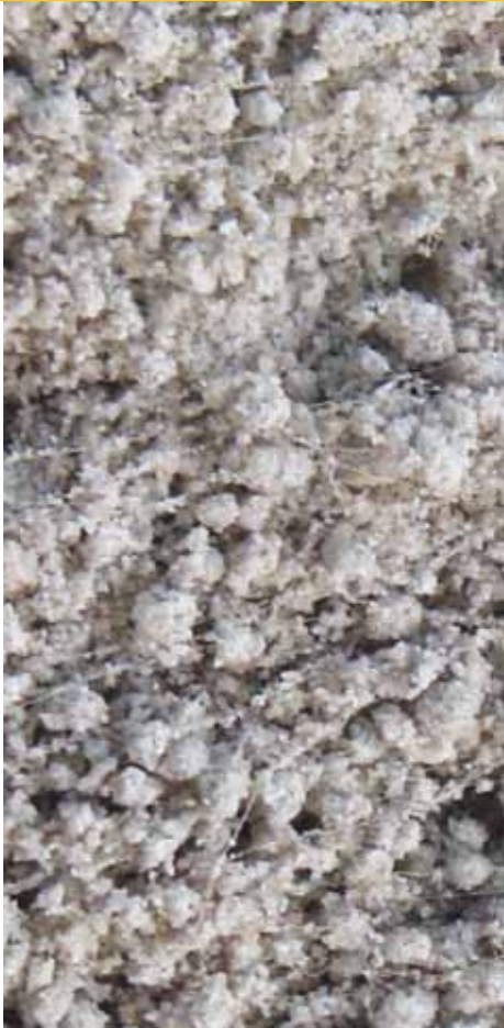
Vorming van aggregaten is wenselijk. Ze verbeteren de verticale drainage.