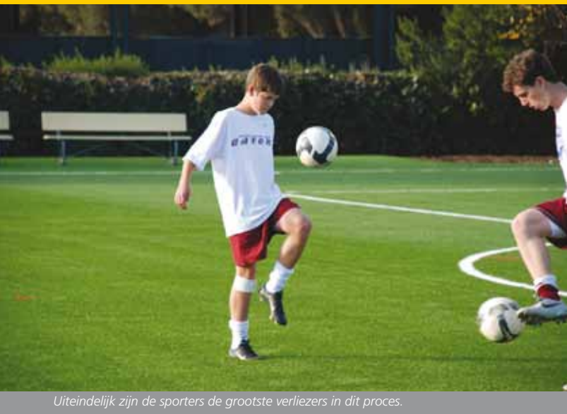
Uiteindelijk zijn de sporters de grootste verliezers in dit proces.