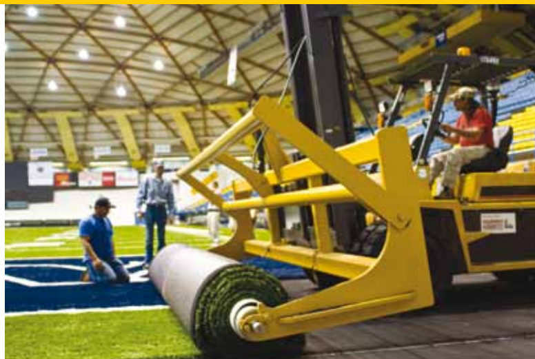
Ook sportveldenbouwer Hellas Construction is inmiddels meegezogen in het proces tussen Fieldturf en TenCate.

Hoewel vooraf vaststond dat de zaak ingewikkeld is en dat het lange tijd zal duren voordat de partijen, met of zonder hulp van een rechter, tot een overeenkomst zouden komen, kreeg begin dit jaar het hele verhaal een nieuwe wending. In de veronderstelling dat 'de aanval de beste verdediging' is, besloot Fieldturf het in Texas gevestigde Hellas Construction Inc. te dagen. Fieldturf wenst te weten waarom Hellas besloot de door tenCate aangeboden Evolution- en Evolution Plus-vezels niet te accepteren, toen het de vezel aangeboden kreeg voor productie in haar mat. Fieldturf vermoedt dat Hellas op dat moment al lucht had van de inferieure kwaliteit van de vezel. Daarom eist Fieldturf dat Hellas alle informatie daarover aan haar overhandigt zodat Fieldturf haar zaak verder kan onderbouwen.