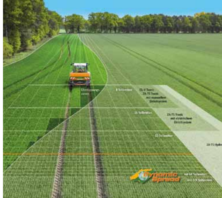
Amazone maakt het nu dankzij section control-software en gps mogelijk maximaal 64 tot 128 strooisecties in te schakelen.

en RO-EDW GEOspread-weegstrooier via gps een ideaal strooibeeld te realiseren. Zo'n Vicon-weegstrooier kun je instellen op het aantal kilo's per hectare, de rijnsnelheid en het type kunstmest. Verder wijst de machine strooisecties ter breedte van minimaal 2 meter toe. De strooibreedte en de dosering (kg/min) passen zich automatisch aan de omstandigheden aan. Het maximumaantal secties is 24. De combinatie van werkbreedte en dosering maakt dit geavanceerde GEOspread-systeem uiterst nauwkeurig. En dit gaat niet ten koste van de VC. Hoe bereikt zo'n machine dit rendement? Productmanager Jos Heinen: 'Dankzij het aanpassen van het uitstroompunt, de plek waar meststof op de schijf terecht komt. Het toerental van de strooischijven blijft daarbij onveranderd. De verminderde overlap bespaart meststoffen, geeft een betere verdeling en de automatische werkbreedteaanpassing geeft veel gebruiksgemak. Op sportvelden gaat het simpel: rij rondom het veld en het gps-systeem geeft aan waar je moet rijden. Als je daarvan afwijkt, sluit de machine tijdig de aanvoer en/of hij zorgt ervoor dat er geen meststoffen terechtkomen waar ze al zijn. Meer informatie is te vinden op www.vicon.nl .