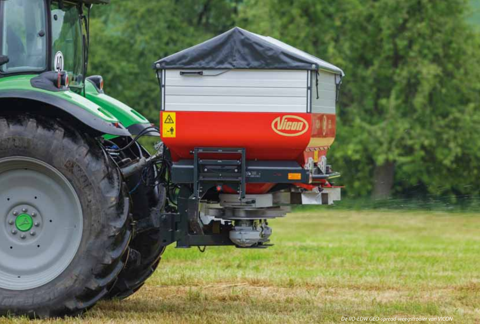
De RO-EDW GEO-spread-weegstrooier van VICON