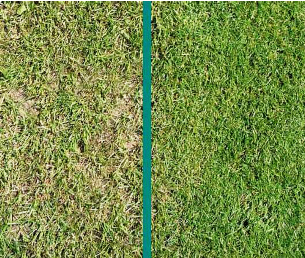
Figuur 1. Verschil in bespelingsstolerantie bij veldbeemdrassen (officieel proefveld Grasgids).

Maxima-mengsels stukken hoger dan bij de gemiddelde Grasgidsrassen. De bespelingsstolerantie bepaalt voor een groot deel hoe gesloten de mat blijft tijdens het seizoen. Dit heeft grote invloed op de vlakheid, stabiliteit en veiligheid van een veld. In figuur 1 is duidelijk te zien wat het verschil is tussen twee veldbeemdrassen qua bespelingsstolerantie: links duidelijk een ras dat is aangemeld voor de Grasgids, maar niet behoort tot de top, rechts een van de toppers van de Grasgids.