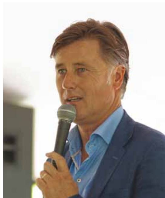
Arent van Dijk V.V. Nijnsel