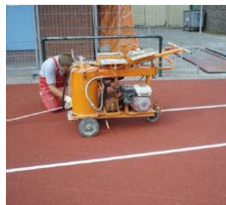
9. Aanbrengen nieuwe belijning