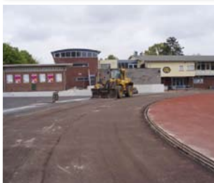
4. Oude topklaag verwijderd