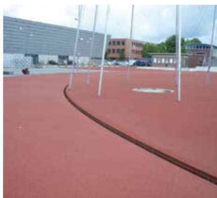
8. Aanbrengen rode spuitlaag