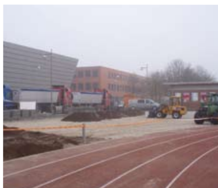
2. Grondwerk na verwijderen tribune ten behoeve van oefenplateau