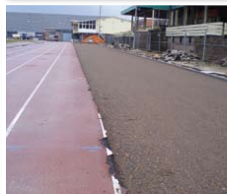
6. Lava-onderbouw uitbreiding sprint