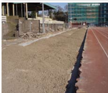
5. Grondwerk tbv extra sprintlanen