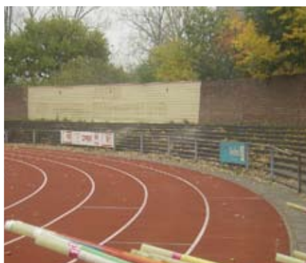
1. Verwijderen oude tribune voor oefenruimte en fietsenstalling

"Na intensieve metingen van Isa Sport bleek helaas dat de demping van de huidige baan niet optimaal was naar de huidige maatstaven"