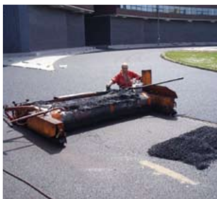
7. Aanbrengen kunststof op asfalt