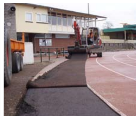
3. Verwijding van de oude kunststoflaag