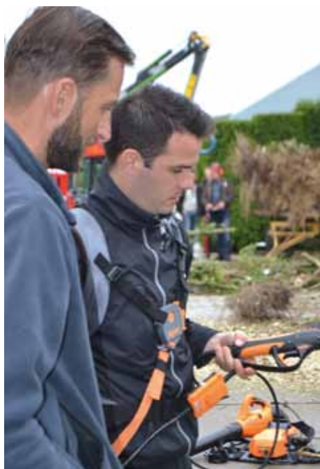
Proeven en demonstraties buiten